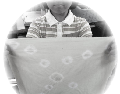
どんな色に染まるかな？ もようも付けてみましょう